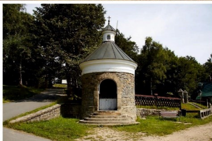
kaple Božího hrobu